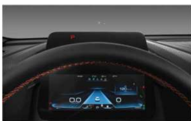
6. Head-Up Display