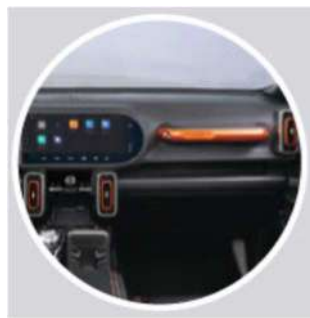
BLACK / ORANGE INTERIOR