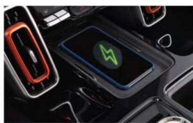
7. WPC - држач за безжично полнење