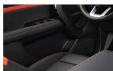
8. Аудио од висока класа Харман систем со Infinity звучници