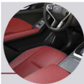
BLACK / RED INTERIOR