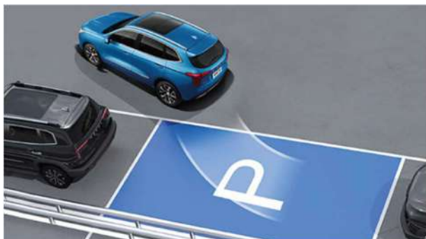
Автоматски асистент за паркирање