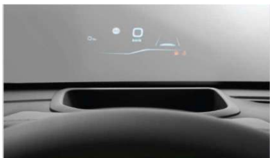
6. Head – UP Display