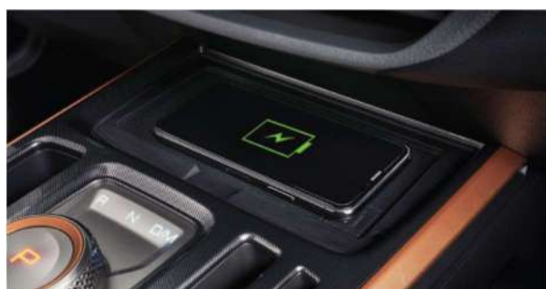
7. Безжичен полнач за мобилен