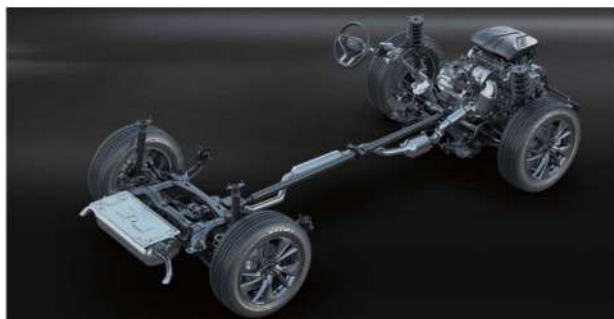
Мекферсон напред и торзиона греда Позади