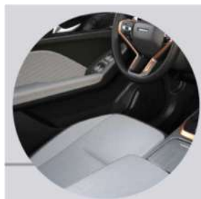
BLACK / GREY INTERIOR