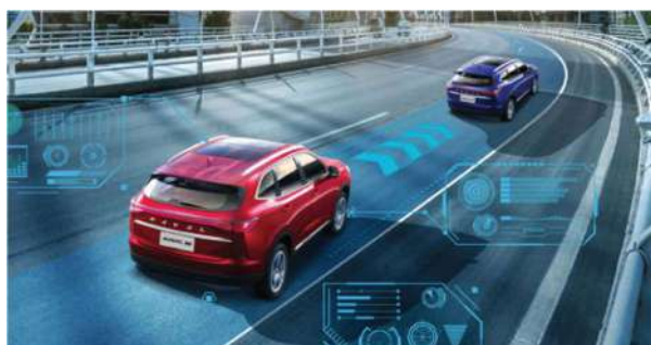
Ниво на автономија L2