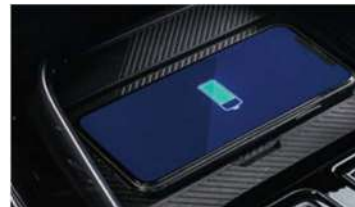
7 Безжичен полнач за мобилен