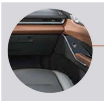
BLACK / BROWN INTERIOR