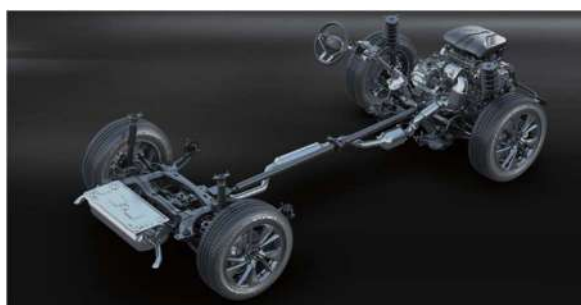
Независна суспензија, Мекферсон напред и мултиврски назад