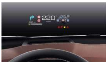
6 Head-Up Display