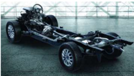
Кутија за трансфер со компјутерска контрола