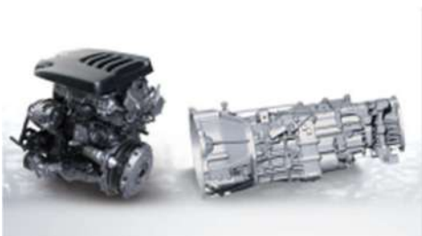
Бензински 2.0GDIT 6MT