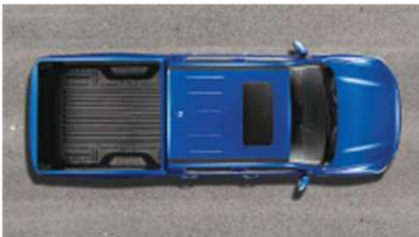
Заштитна обвивка на товарен простор